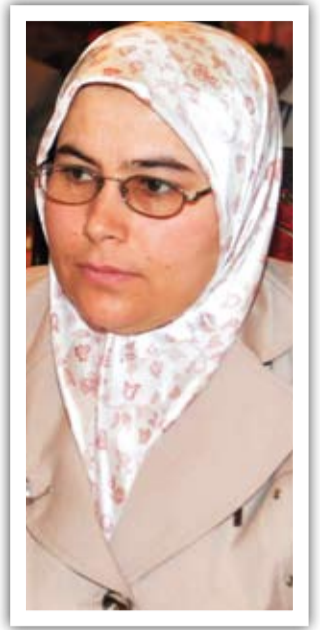
هه‌لله محمهد - به‌شی دووه‌مو کۆتایی ..

مروّقبوونی ژنه‌وه، مروّقبوونی تیکشکێنراو به‌لکو مروّقبوونی هه‌مو مروّقایه‌تی که‌وته ژێر پرسیاره‌وه، چونکه هه‌ست و وزه‌ی مروّقه‌کان به‌پیاو و ژنه‌وه که‌وته ژێر ده‌ستی کۆمه‌لێک بنه‌ماو مه‌به‌ست له‌بوونی سه‌ره‌کیان له‌لا فه‌رامۆشکرا ..