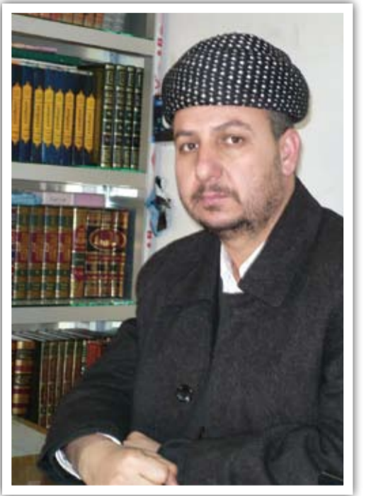
ئاینده: دیمان‌هی گولان حه‌مه‌مه‌مین

ده‌ریاره‌ی ئه‌و ژنانه‌ی هاوشانی براو هاوسه‌ره‌کانیان کارده‌کن، به‌لام له‌کاتی میرات دابه‌شکردندا هه‌روه‌ک که‌سیکی تر میراتیان پێ دهریت، له‌راستیدا ئه‌مه‌ سته‌مه، چونکه‌ ئایه‌ته‌کان ئاماژه به‌وه‌ده‌که‌ن (وللنساء نصیب مما اکتسبن) ژنان مافی خۆیانه‌ که ئه‌وه‌ی که‌سی خۆیانه‌ بۆخۆیان بێت، هه‌روه‌ک بۆ پیاویش وایه (للرجال نصیب مما اکتسبوا) که‌واته‌ ئه‌وه‌ مافی خۆیه‌تی و جیاوازه له‌میرات! وه‌هه‌ر له‌سه‌ری واجب نیه‌ به‌و کاره‌ هه‌لسیت، به‌لام ئه‌گه‌ر له‌به‌ر (موده) و (رحمه) پێتی هه‌لسا ده‌بێن چی مه‌سه‌ره‌فی کردوه‌ بیدریت، واته‌ میراته‌که‌ی بدریت، هه‌روه‌ها ئافره‌ت له‌کاتی گرێبه‌ستی هاوسه‌ریدا ده‌توانیت بلیت با (شراکه‌ الأبدان) مان هه‌بێن که‌ گرێبه‌ستیه‌که‌ هه‌رچی‌یان په‌یدا کرد به‌یه‌کسانی له‌نیوانیاندا دابه‌ش ده‌کریت، یان به‌هه‌رپێژه‌یه‌ک له‌سه‌ری پێکه‌وه‌ن، ئه‌مه‌ بێجگه‌ له‌میرات، هه‌روه‌ک کاک ئه‌مه‌ده‌ی موفتی زاده‌ش ئاماژه‌ی پێکردوه‌. پۆشنییری ئایینی له‌ولاتی ئیله‌م‌دۆز ل‌اوازه، میژوو وکۆمه‌لگاش وایان کردوه‌ که‌که‌م گزنگی به‌ئا‌فهرت بدریت. ده‌ریاره‌ی ئه‌وه‌ی زانایانیش سته‌میان له‌ژنان کردوه‌ نمونه‌ی به‌وه‌هێناوه‌ که‌: