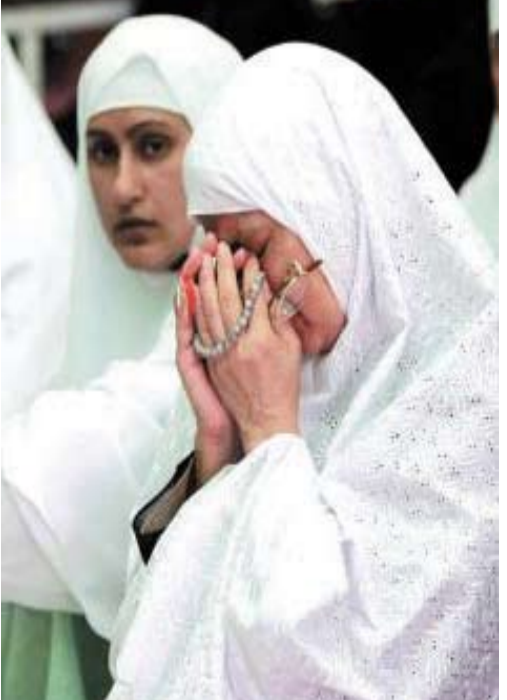
لای که‌عه‌به، خۆشترین ساته‌کانی ته‌مه‌نه