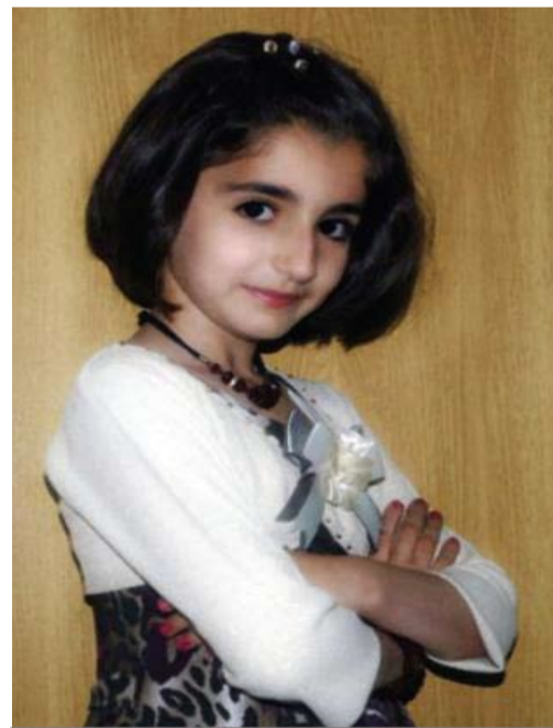
دیمه به شار